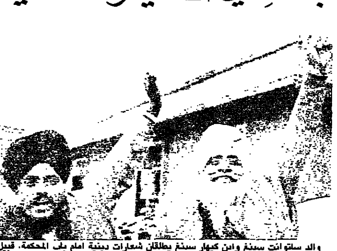
والد ستواتر سينغ وابن كيهار سينغ يطلان شرفات دينية امام باب الحكة . قبيل ساعات فقط من ابرام حكم الاعدام

بعد رفض آخر استرحاماتها حكم الإعدام ينفذ اليوم بقاتي أنديرا غاندي